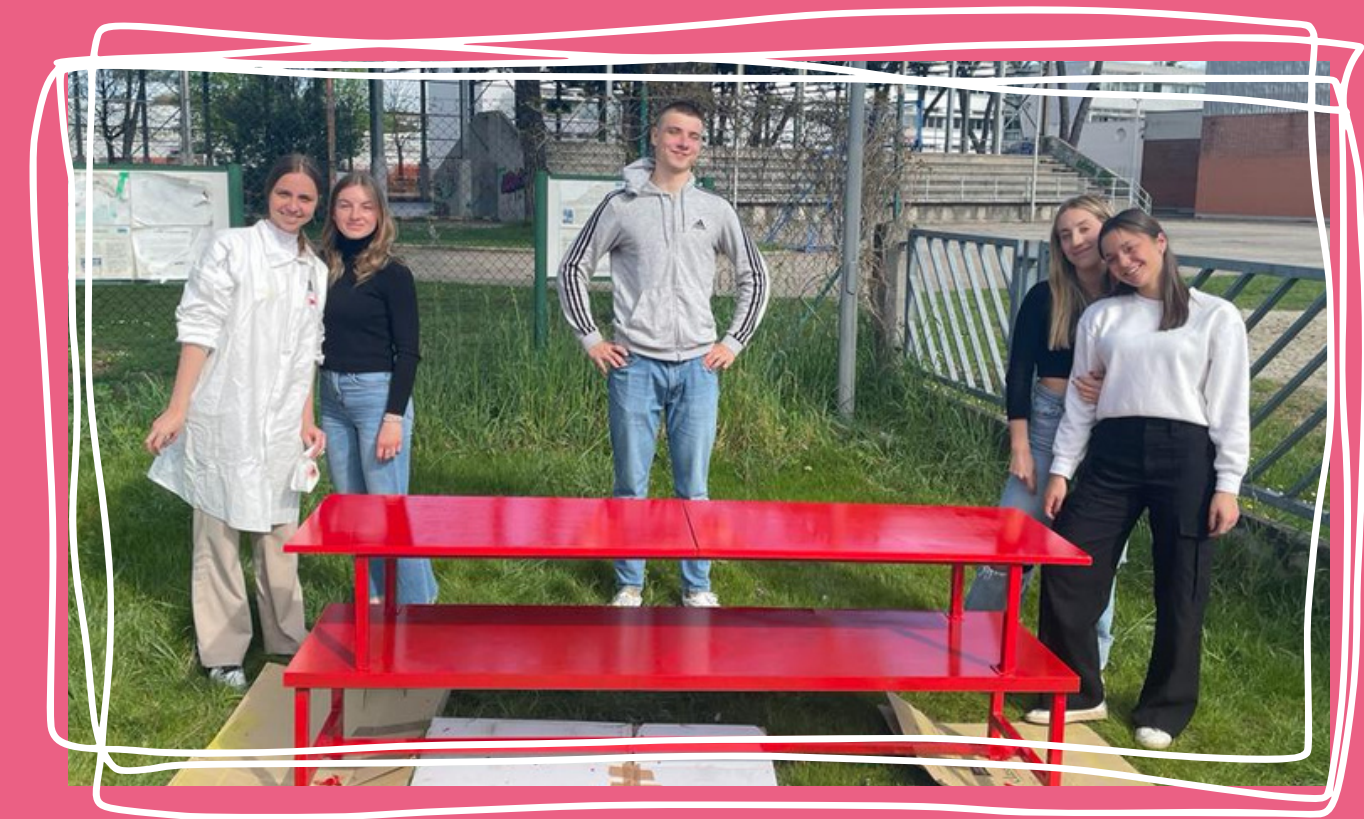
alcuni compagni mentre dipingono il nostro angolo letture a tema

Abbiamo scelto alcune opere d'arte che si collegassero con il tema della violenza sulle donne cercando tra statue e quadri degli spunti di riflessione.